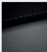
Origo® Stoff schwarz