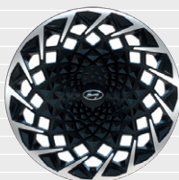
mit DESIGN Pack Leichtmetallfelgen 20" mit Reifen 255/45 R20