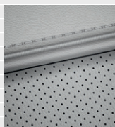
Vertex® Leder grau