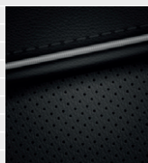
Amplia®, Vertex® Leder schwarz