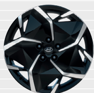
Origo®, Amplia®, Vertex® Leichtmetallfelgen 19" mit Reifen 235/55 R19