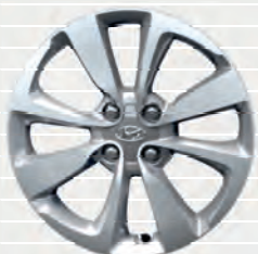
Vertex® 195/55 R16