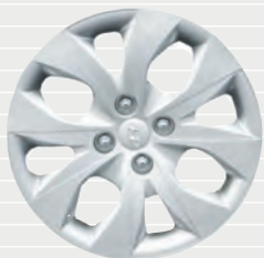
Pica® / Amplia® 185/65 R15