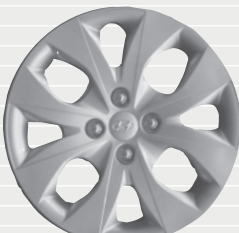
exxtra® 185/65 R15