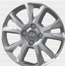
exxtra® Plus 185/65 R15