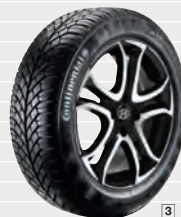
Winterkometräder Continental auf Alufelgen 16" mit TPMS