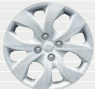
Origo® 185/65 R15