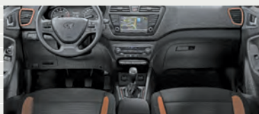
Amplia® Stoff schwarz/orange Comfort Grey