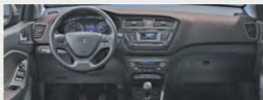
Vertex® Cappuccino 1