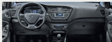
Vertex® Comfort Grey