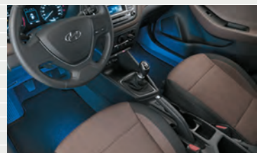
LED Fussraumbelichtung blau

■ = Serienausstattung - = Nicht erhältlich