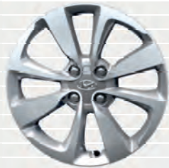
Amplia® 195/55 R16