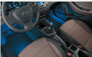
LED Fussraumbeleuchtung blau

■ = Serienausstattung - = Nicht erhältlich