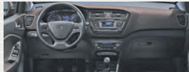
Vertex® Cappuccino 1