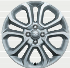
Vertex® 205/45 R17