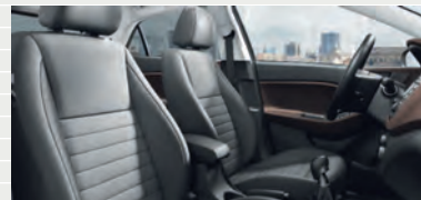
Vertex® Leder schwarz