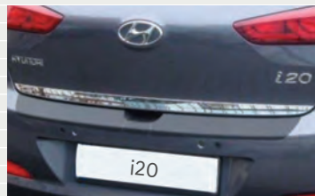
Zierleiste verchromt für Heckklappe