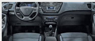
Origo® Stoff Grey Blue