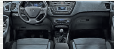
Origo® Stoff Grey Blue