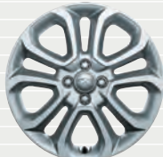
Vertex® 205/45 R17