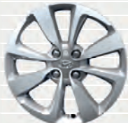
Amplia® 195/55 R16