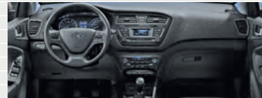
Vertex® Comfort Grey