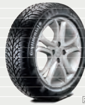
Winterkomplettreder auf Alufelgen 17" mit TPMS