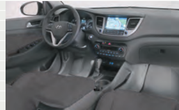
LED Fussraumbelichtung weiss