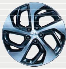
exxtra® Plus / Vertex® Leichtmetallfelgen 19" 245/45 R19