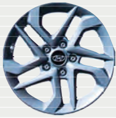
Origo® Leichtmetallfelgen 16" 215/70 R16