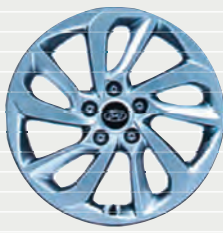
Plena® Leichtmetallfelgen 17" 225/60 R17