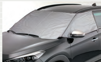
Eis- und Sonnenschutz