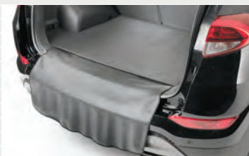
Antirutschteppich mit Ladekanten-Schutzmatte